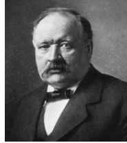
Svante Arrhenius (1859-1927)

Révolution industrielle: Recours aux énergies Fossiles, urbanisation massive